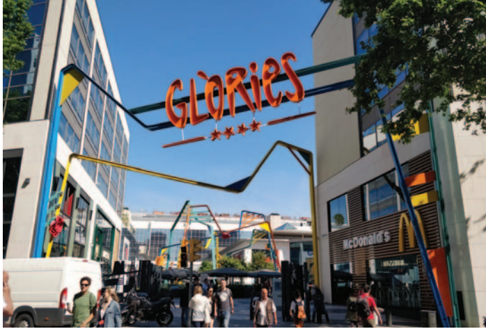
Accés de l'avinguda Diagonal