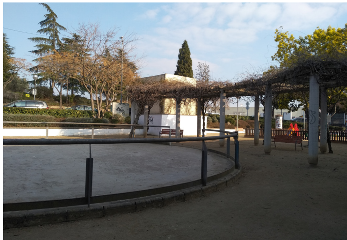
Ejemplo de espacios libres sin actividad (Plaza del Romaní, Polinyà).