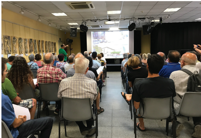
Sesión de “superilles” en el barrio de Horta