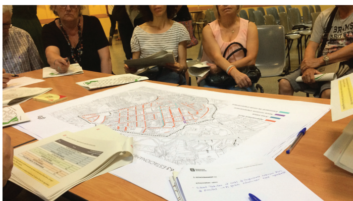
Sesión de “superilles” en el barrio de Horta