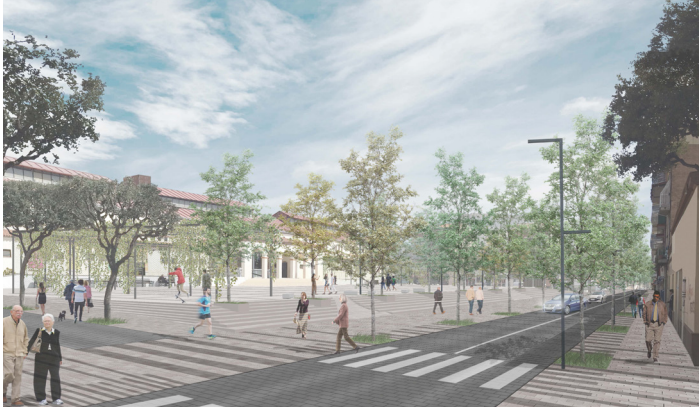
Vista de la avenida y la plaza de Catalunya