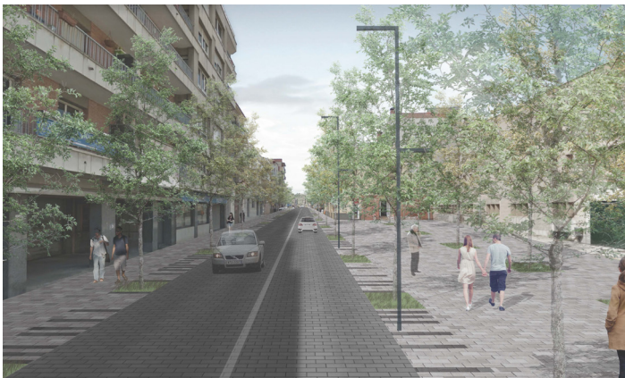
Vista de la avenida y la plaza del Oli