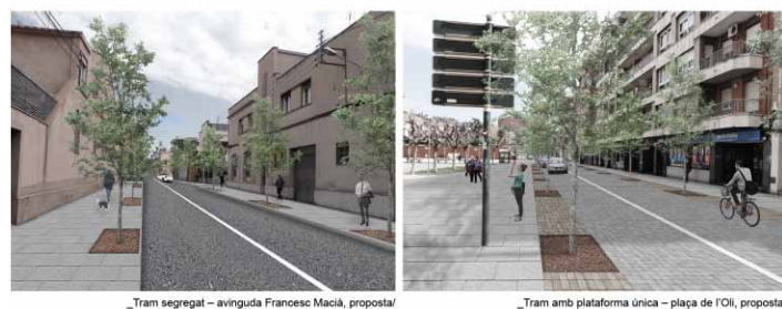
Propuestas para los distintos tramos de la avenida