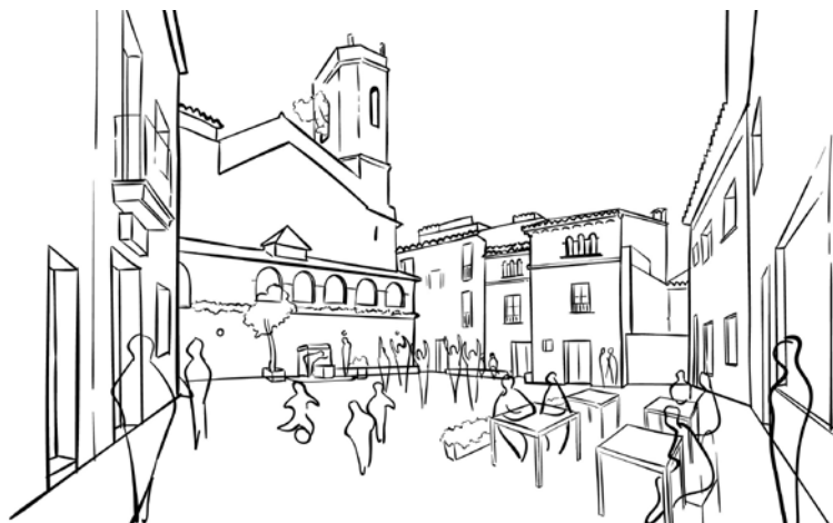
Propuesta para la Plaça de Riells